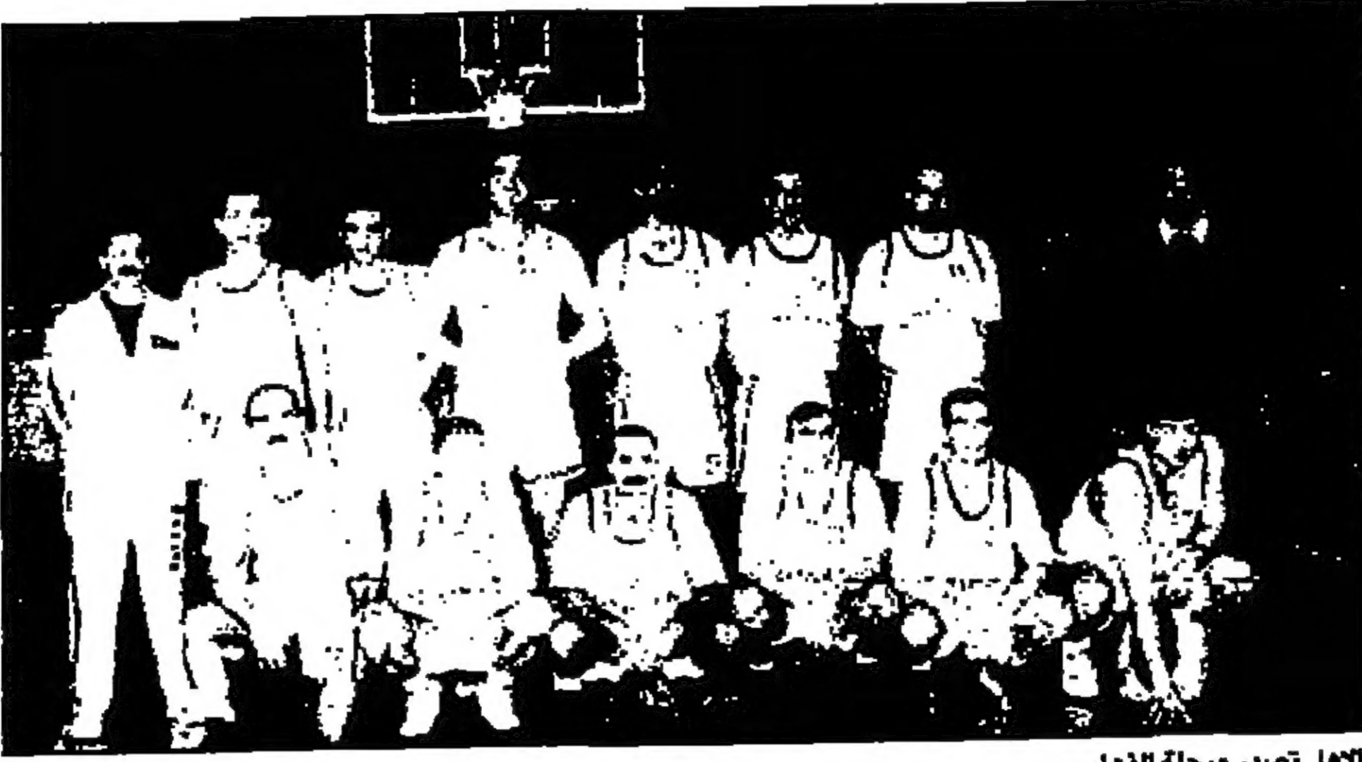
الاهلي تصدر مرحلة الذهاب